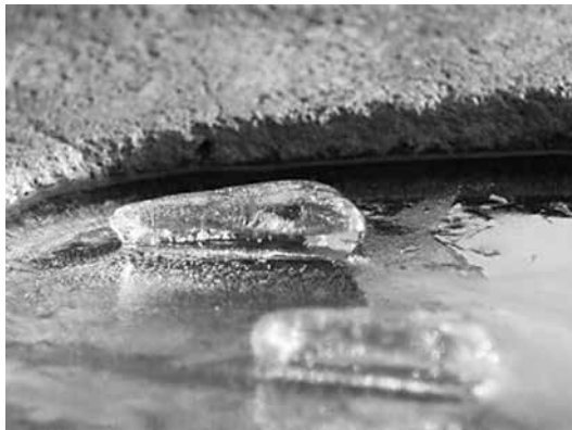
神の玉坐 スフィンクス